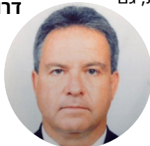
דרור זסלר | צילום: יח"צ

"מדובר במקרה המצריך פרוצדורה רפואית דחופה, ואני שמח כי הצלחנו לקבל אישור חריג להטיס את המבוסס לישראל במצבו הרפואי הנוכחי, לקבלת המשך טיפול מיטבי בבית חולים בארץ. גם בימים לא פשוטים אלה, אנו עושים כל שנדרש כדי להבטיח את שלומם וביטחונם של מבוססחנו. אני מאחל למבוסס רפואה שלמה ומקווה במהרה לימים של ביטחון ושקט עבור כל מדינת ישראל".