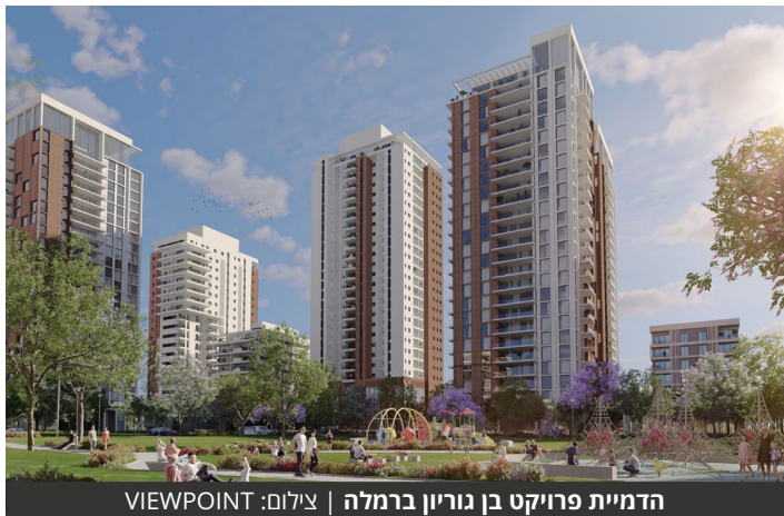
הדמיית פרויקט בן גוריון ברמלה

כמו כן, הפרויקט יכלול כ-7,500 מ"ר שטחי מסחר וכ-5,600 מ"ר שטחי משרדים, לצד מבני ציבור ושטחים לרווחת התושבים. הפרויקט משתרע על שטח של כ-150 דונם, בין הרחובות יהודה שטיין, שדרות בן גוריון, שדרות דוד רזיאל וא.ס. לוי ברמלה, ויבנה ב-6 שלבים.