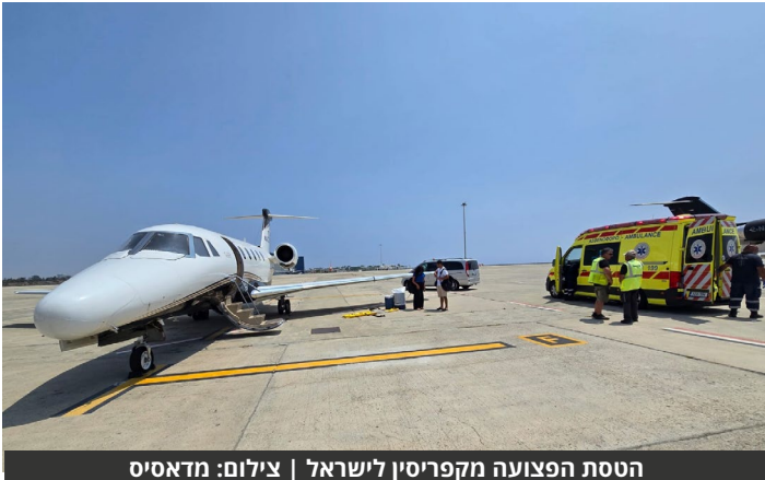
הטסת הפצועה מקפריסין לישראל

ובתיאום עם גורמים בארץ ובחו"ל, אושר פינוי המבוסס באמבולנס אווירי לישראל. המבוסס נחת בישראל ביום ב', לאחר טיסה של כ-8 שעות, והוא הועבר להמשך טיפול בבית חולים בישראל.